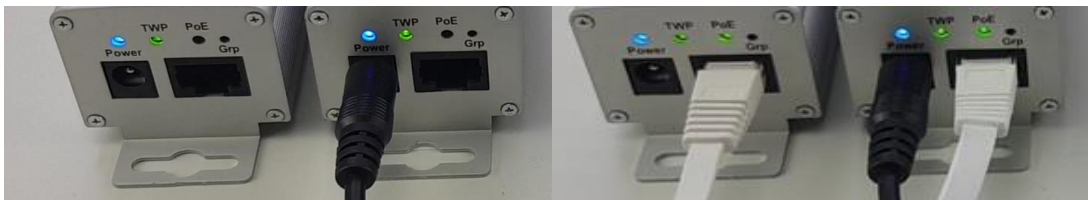
Oba převodníky jsou vzájemně propojeny